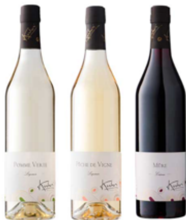
Poma verda-préssec de Vinya i mora