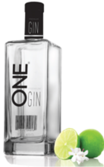
Ginebra Premium Destil•lada i embotellada Al Maresme