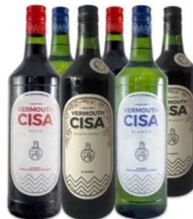
Negre, blanc i ecofriendly