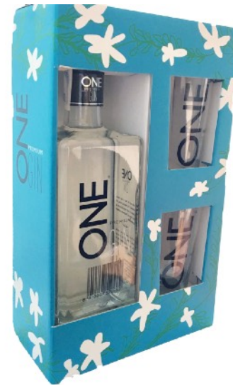
Estoig de cartró +1 amp. + 2. gots